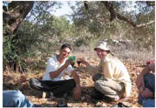
نویسنده و یک دوست فلسطینی، در هنگام استراحت حین چیدن محصول زیتون، در حال نوشیدن چای هستند

برای برگشت به خانه باید زیاد پیاده راه میرفتیم. علاوه بر اینکه میبایست یک مسیر انحرافی بلند را برای دور زدن بزرگراه اسرائیلی طی میکردیم، مجبور بودیم تمام زیتونهای چیده شده آن روز را یکجا بار بزنیم چرا که ظاهراً گزارشاتی از دزدیده شدن زیتونها توسط شهرک نشینان گزارش شده بود. هنگامی که به خانه مان در حارس رسیدیم، خبر دستگیر شدن یک کشاورز ساکن دهکده مجاور هنگام چیدن زیتون در حالی که خانواده و سه داوطلب بین المللی او را همراهی میکردند به گوش ما رسید. خوشبختانه چندین گروه متوجه این مورد شده و عکس العمل نشان داده بودند. یک گروه صلحجوی اسرائیلی با عنوان Rabbis for Human Rights (RHR)، که بنا بر سنت یهودی Tikkun Olam یا همان فعالیت اجتماعی در برابر نقض حقوق بشر در اسرائیل و سرزمینهای اشغالی میجنگند، فعالیت خود را برای آزادی کشاورز فلسطینی آغاز کرده بودند. گزارشگران شبکه CNN که بطور اتفاقی در هنگام این واقعه در منطقه بودند نیز احتمالاً روایتی از این داستان تعریف خواهند کرد. ما با این اوضاع رسانه های بین المللی و همدردی با اسرائیل در این مورد خوشبینیم و به همین دلیل تعدادی از ما برای از سرگیری برداشت محصول فردا به دهکده میرویم.