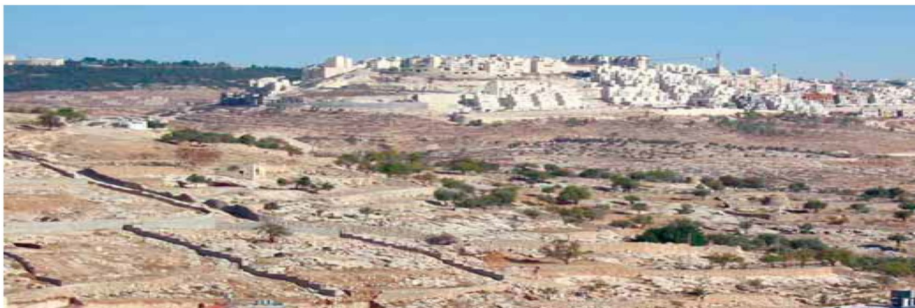
شهرک هارحوما در بیت لحم

شهرکهای یهودی‌نشین در واقع شهرها یا محله‌هایی هستند که توسط دولت اسرائیل به منظور اقامت اختصاصی یهودیان در سرزمینهایی که جامعه بین‌الملل متعلق به فلسطینیان میدانند ساخته میشود. شهرکسازی یهودیان در تناقض آشکار با مفاد کنوانسیون چهارم ژنو میباشد که بنابر آن، دولت اشغالگر حق ندارد شهروندان خود را به سرزمینهای اشغال شده (در اینجا کرانه باختری، نوار غزه ۱ و بیت المقدس شرقی) منتقل کند. در بسیاری از زبانها، مانند فرانسه، کلمه مورد استفاده برای توصیف شهرکهای اسرائیلی همان کلمه مستعمره می‌باشد در حالی که در انگلیسی و عبری کلمه ملایمتری برای این منظور به کار میرود: از افرادی که در شهرکهای یهودی‌نشین زندگی میکنند به عنوان مهاجرین یاد می‌شود و نه به عنوان استعمارگر.