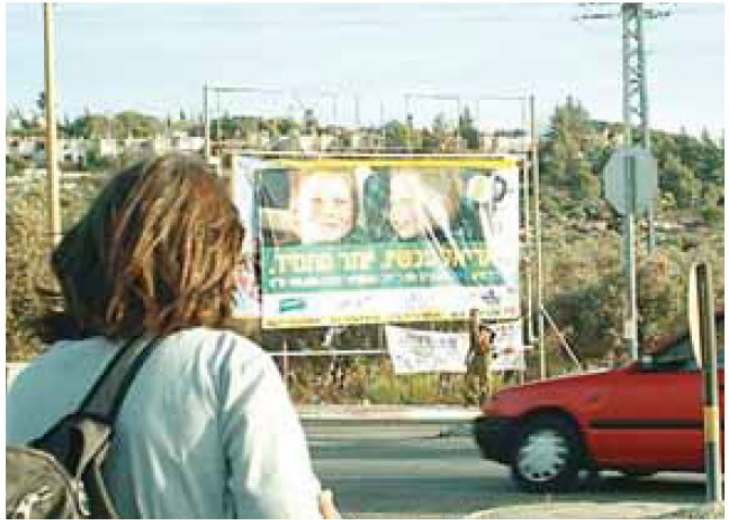
یک تابلوی تبلیغاتی خارج شهرک اریئیل که پیشنهاد پرداخت مبلغی بیش از ۲۰,۰۰۰ دلار آمریکا را در ازای نقل مکان به شهرکهای اسرائیلی در کرانه باختری را میدهد.

تعداد اندکی از شهرک‌نشینان زندگی در سرزمینهایی فلسطینی را به دلایل سیاسی و یا مذهبی انتخاب میکنند. بسیاری از شهرک‌نشینان ایدئولوژیک - در برابر اقتصادی- مکرراً خانواده‌ها و کشاورزان فلسطینی را تهدید کرده و یا مورد حمله قرار میدهند زیرا باور دارند که فلسطینیان سرزمینی را که خدا به یهودیان وعده داده است را اشغال کرده‌اند. بخاطر خطرات فزاینده حملات این دسته از شهرک‌نشینان، بسیاری از کشاورزان تقاضای همراهی گروههای صلح اسرائیلی و یا سازمانهای بین‌المللی را با خود دارند. در این روش امید این است که شهرک‌نشینان مهاجم در برابر این گروههای اسرائیلی و بین‌المللی از خود خودداری نشان دهند، از روی شرم و یا بخاطر اینکه احتمال دارد ما