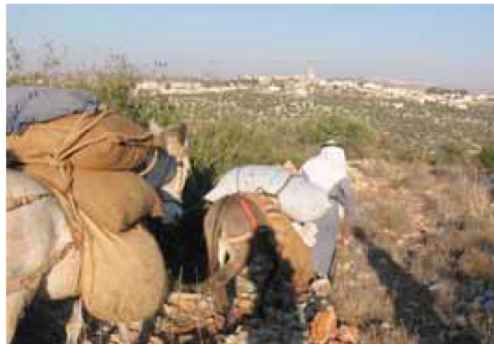
یک کشاورز پس از یک روز برداشت زیتون به خانه برمیگردد.